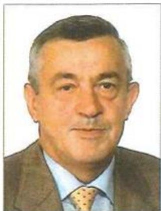
Jef Potlood 9/06/2020

Tijdens deze coronatijd moesten we afscheid nemen van 2 leden, deze zullen herdacht worden tijdens de misviering voor ons gildenfeest, van begin januari.